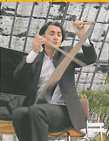
Solistes aux serres d'Auteuil (16°).

passions humaines et les croisements de styles, de genres et d'arts. À voir, les cartes blanches à de jeunes comédiens de l'École Jacques-Lecoq et un docu-fiction. → 20, avenue Marc-Sangnier. Rés. au 01 45 45 49 77. www.grrrcompagnie.com