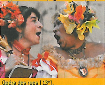
Opéra des rues (13°).