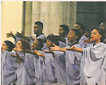
Festival Paris Go-Spell (12°).

'été fite de la ir accueillir sans scène ont à l'affiche ducteurs, la ns, les